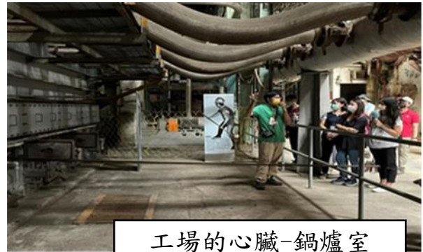
工場的心臟-鍋爐室