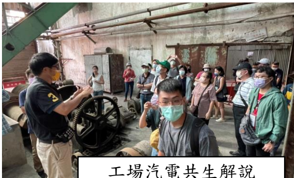
工場汽電共生解說